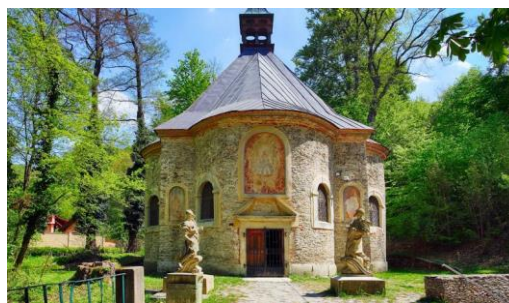
A máriavölgyi Szent Kút kápolna 1696-ból